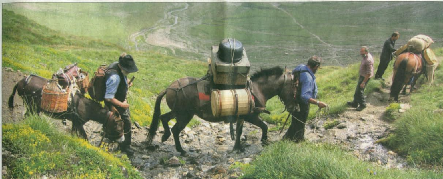
Immer wieder ziehen die Lasttiere samt ihren Begleitern den weniger trainierten Wanderern auf der Sbrinz-Route davon.